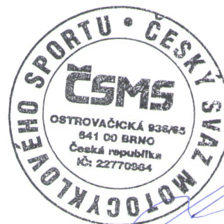
Barbora Svobodová Sekretariát ČSMS

Schváleno Sekretariátem ČSMS dne 06. 06. 2012 pod číslem ČSMS 22/2012